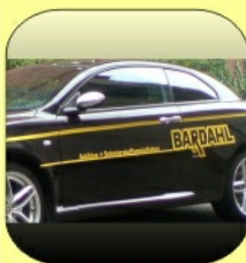
Auto, moto, kart, quad, scooter, Werkstatt